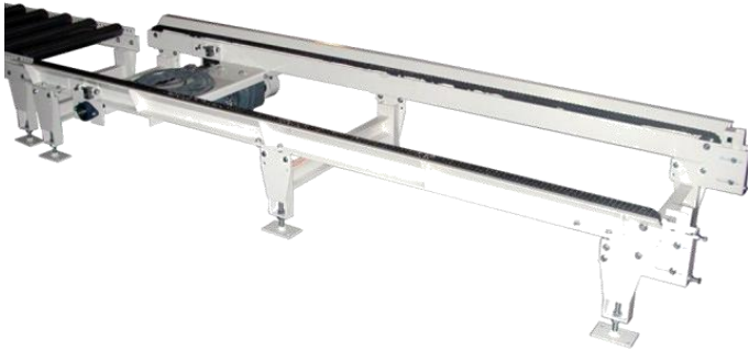
Transporteur Bi-Chaîne TBC